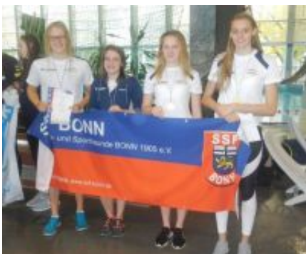
Die Siegerinnen in der weiblichen Jugend A

Am 11. und 12. November 2017 richteten die SSF Bonn im Bonner Frankenbad die Deutsche Mannschaftsmeisterschaft der Jugendklassen (DMS-J) für den Schwimmbezirk Mittelrhein aus. Die DMS-J wird als Staffelwettbewerb ausgetragen, wobei die Jugend A, B und C über jeweils 4x100 m Schmetterling, Rücken, Brust, Freistil und Lagen antreten. Die Jugend D schwimmt anstelle der 4x100 m Schmetterling lediglich 4x50 m. In der Jugend E werden Mixed-Staffeln über 4x25 m Schmetterling,