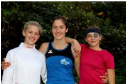
Die Vizemeister