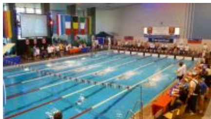
Das SSF Meeting im Frankenbad

Vom 24. bis 26.11.2017 richtet die Schwimmabteilung der SSF Bonn im Bonner Frankenbad das 40. Internationale Jugendmeeting aus.