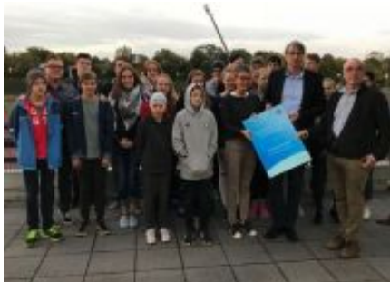
Übergabe des Stützpunktschildes