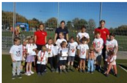
KiA Kids beim Volkslauf

Zum ersten Mal haben wir mit Kindern der KiA Sportgruppen an einem Volkslauf teilgenommen. Mit 16 Kindern von Kia - Mini bis Kia - Tiger sind wir nach Hangelar gefahren, um 400m, 800m oder 1000m zu laufen. Fast alle haben zum ersten Mal an einer Laufveranstaltung teilgenommen und waren dementsprechend aufgeregt. Unsere jüngsten Teilnehmer sind zwei Jahre alt und rannten auch schon 400m um den Hangelarer Sportplatz. Alle hatten viel Spaß und zwei schafften es sogar auf das Treppchen. Für alle Teilnehmer gab es Medaillen und einen kleinen Preis. Eine rundum schöne Veranstaltung bei bestem Wetter. Wir werden das sicher wiederholen.